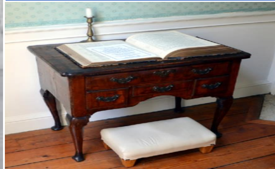
요한 웨슬리의 기도책상과 기도 의자

1989년 9월부터 12월까지 영국 London교외에 있는 WEC 선교부에서 선교 훈련을 받을 때에 London에 있는 요한 웨슬리의 주택을 방문하였다 그곳에서 요한 웨슬리의 “기도 책상과 기도 의자”