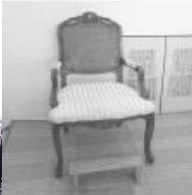
나의 기도 의자와 무릎받침대

1980년 3월, 영국 Scotland Edinburgh에서 열린 세계선교대회에 참석했을 때, 요한 낙스의 집을 방문하였다 요한 낙스의 “기도방” (2층)