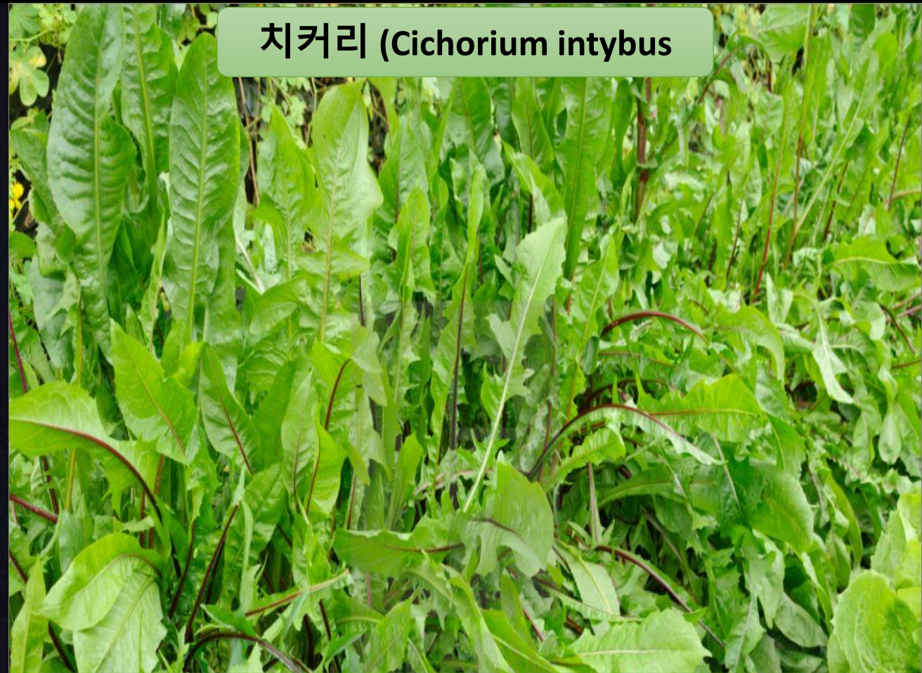
치커리 (Cichorium intybus)

무교병은 예수 그리스도의 살을 뜻 한다(요6:54-55) 누룩(죄악)을 제거한 성화된 삶 (구원 받은 후의 삶) 선악과(자기의 뜻, 견해, 혈기)를 하나님께 반납 십자가에서 나는 죽고 아버지의 뜻이 이루어지는 삶